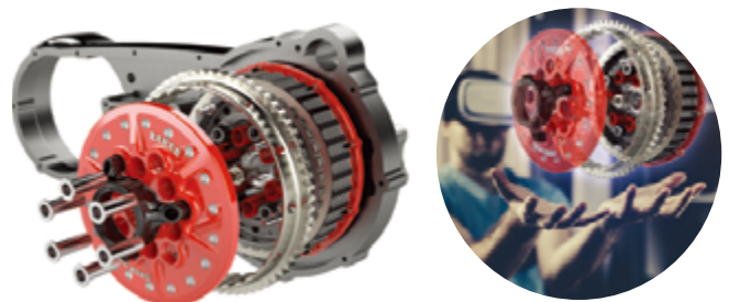
模型由 BAKER Drivetrain 提供